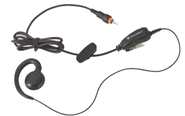
Kopfhörer mit integriertem PTT button

Dieses revolutionäre, klare Design erlaubt ein schnelles Aufladen Ihres Motorola CLPs. Ein Multi-Unit-Ladegerät erlaubt es Ihnen bequem bis zu sechs Motorola CLPs simultan aufzuladen. Das Ladegerät ist mit einer Tasche auf der Rückseite ausgestattet, um die Kopfhörer darin zu verstauen, während das Gerät lädt und es kann an der Wand angebracht werden, wenn es über einen Premiumplatz verfügt.