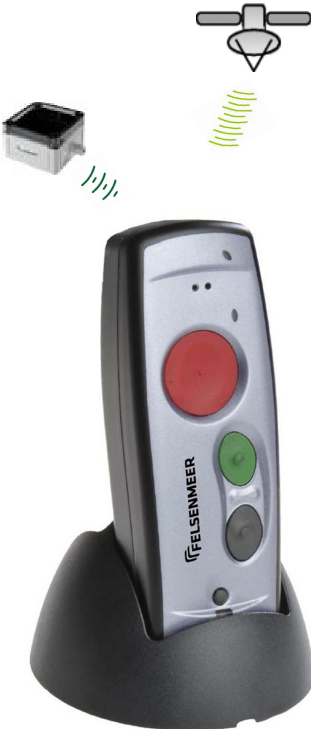
Personen-Sicherungsgerät D.A.N.-Shalosh Maßstab 1:1

Lieferumfang: GSM-Gerät - Li-Ion Akku - Clip Tischladegerät 230VAC